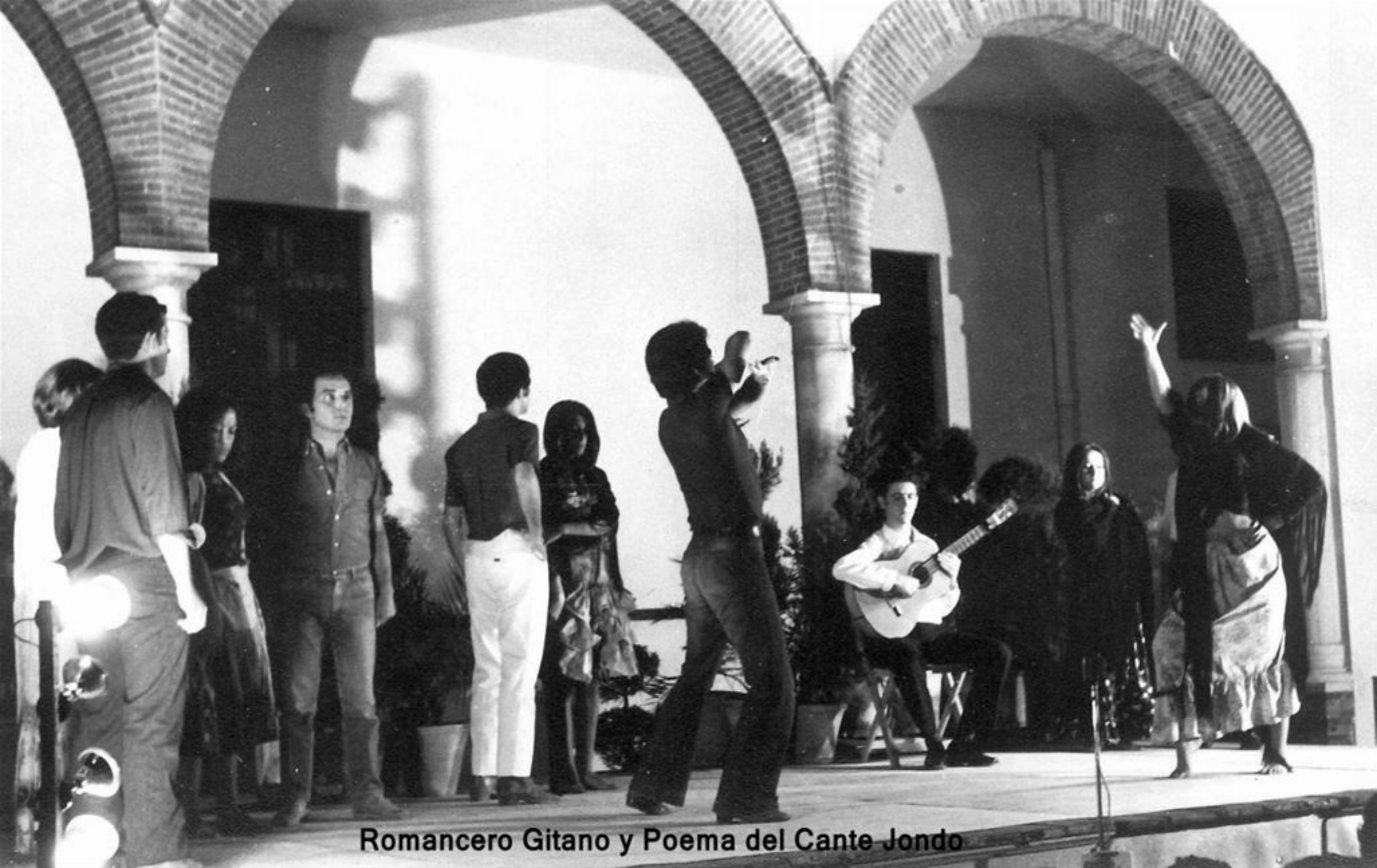
Romancero Gitano y Poema del Cante Jondo